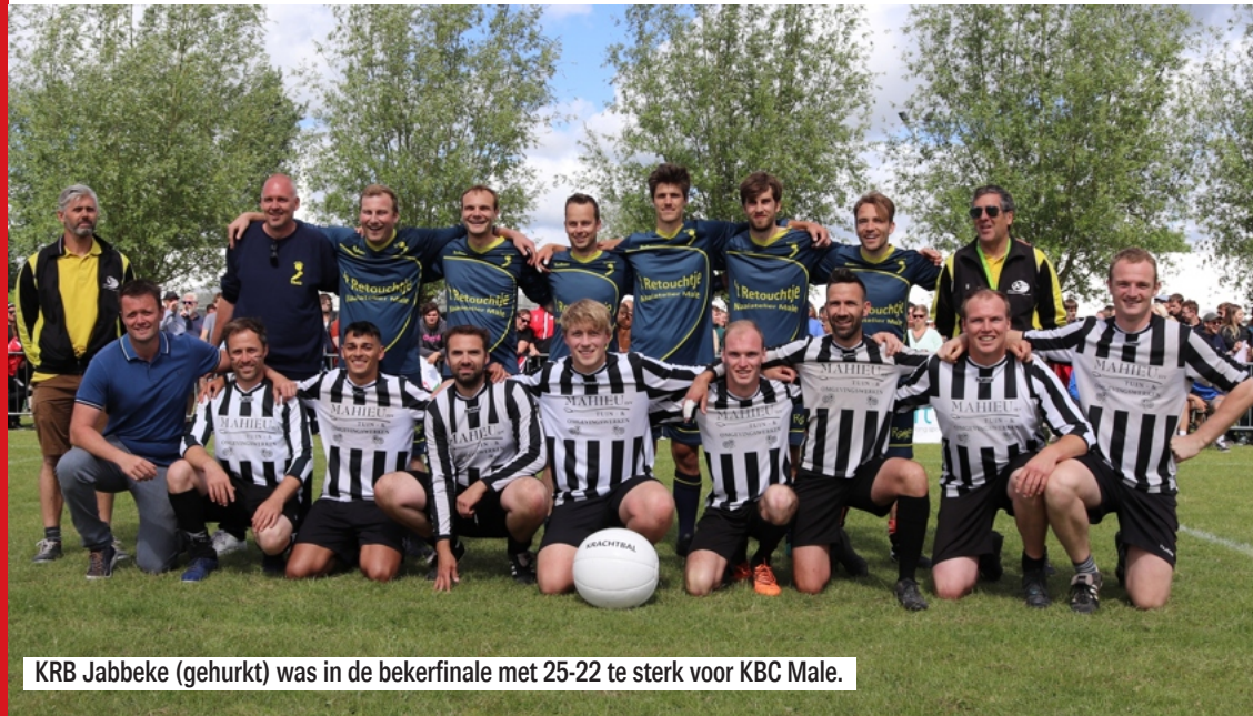
KRB Jabbeke (gehurkt) was in de bekerfinale met 25-22 te sterk voor KBC Male.